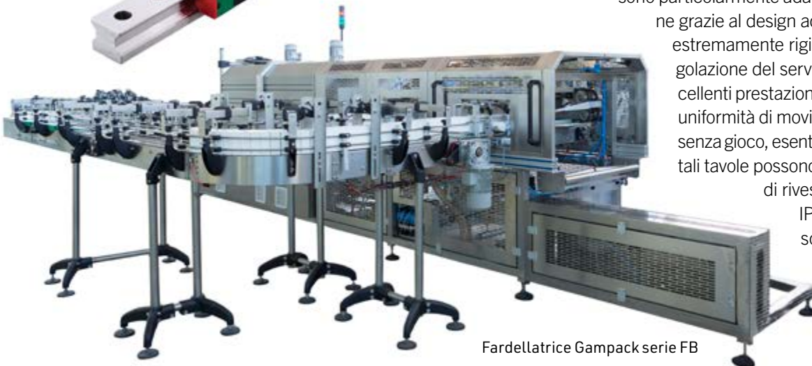
Fardellatrice Gampack serie FB

Precisione nella movimentazione dei colli e l'alta dinamica, sono garantite in questo progetto anche dalla presenza della tavola rotante con motore torque sempre fornita da Hiwin e appartenente alla serie TMN, esecuzioni che sono particolarmente adatte per le attività di automazione grazie al design ad albero cavo. La connessione estremamente rigida tra motore e carico e la regolazione del servo azionamento assicurano eccellenti prestazioni di accelerazione e una buona uniformità di movimento. Dotate di azionamento senza gioco, esenti da manutenzione e compatte, tali tavole possono essere opzionalmente dotate di rivestimento conforme a standard IP65, di freno integrato, di sensore di Hall integrato, piuttosto che di encoder o resolver per un ambiente di lavoro flessibile. «Velocità, bassa rumorosità – sottolinea